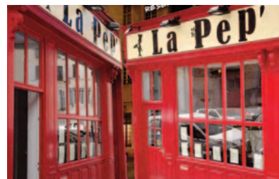
Restaurant du mercredi soir

36 avenue de la Chartreuse 54510 ART SUR MEURTHE Tél. +33 3 83 56 97 76