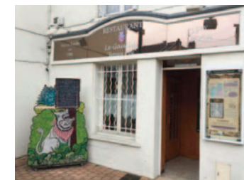
Restaurant du jeudi soir

4 rue des Cordeliers 54000 NANCY Tél. +33 3 83 35 28 45