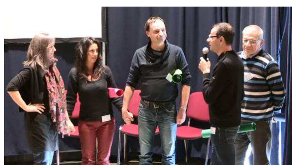
L'équipe des Tout-terrains : la bienveillance

Chez les tout-terrains, un chargé de projet tiers temps qui se sent seul prend conscience des compétences acquises par le collectif qu'il anime : meilleure communication, écoute des attentes de chacun, délégation des actions et meilleure efficacité. La co-création d'outils de pilotage permet d'avancer avec plus de rigueur : planification, fiches actions... Cela permet aussi une meilleure capitalisation du travail accompli. Le chargé de projet se trouve rassuré quant à la pérennité de cette dynamique, même après la fin de la décharge !