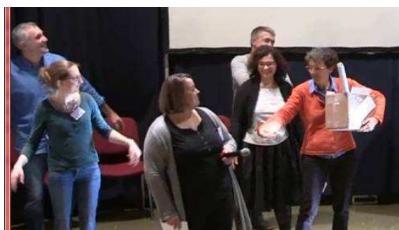
L'équipe du Vol migratoire : la rigueur et l'organisation

Les deux groupes (les Tout-terrains et le vol migratoire) se sont interpelés par une Battle bienveillante sur les principales compétences collectives acquises et à remobiliser.