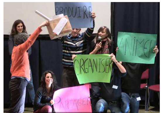
Organiser, partager, animer, produire et ... capitaliser !

Schématisation des relations entre différents collectifs, représentés par les cercles, et de leurs compétences et place du porteur de projet (TT) au sein de ces collectifs