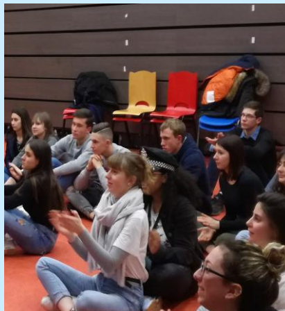
Le groupe d'Orange au Réseau Jeunes en Mobilité à Florac en janvier 2019