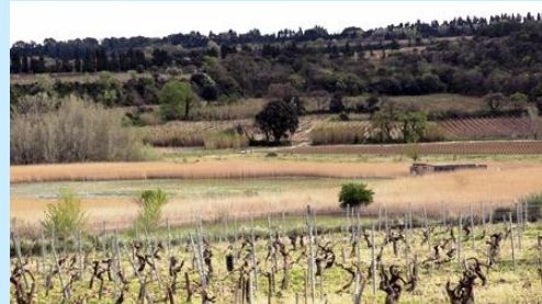
Etang salé de Courthézon

Vendredi 17 mai 2019 8h30-12h30 : Etang salé de Courthézon