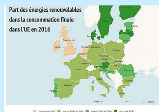
Part des énergies renouvelables en Europe, 2016

https://www.quelleestvotreeurope.fr/je-participe.html