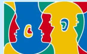
Journée Européenne des Langues

Comme l'an dernier plusieurs ateliers ludiques, socioculturels et linguistiques auront lieu, sous l'égide des enseignantes de langues