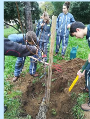
Fabrication de planches et plantation d'arbres pour le jardin en EIE avec les 2VV