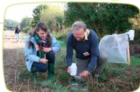
La mise en place de l'agro-écologie implique une bonne connaissance des cycles biologiques des insectes sur les parcelles, qu'ils soient ravageurs ou auxiliaires.

• Le changement d'affectation des sols : Au croisement de tous les enjeux cités ici, les choix agricoles français s'insèrent dans un contexte mondial de forte demande alimentaire et de pression sur les milieux. S'ils sont aujourd'hui difficiles à chiffrer, ces impacts doivent impérativement être pris en compte.