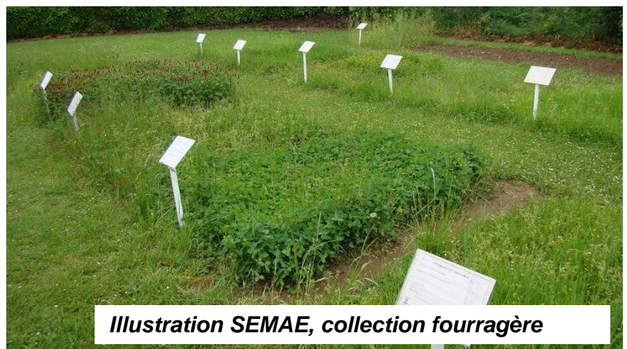
Illustration SEMAE, collection fourragère

N'hésitez pas à nous contacter si vous souhaitez associer des classes à la mise en place (implantation le jour j) ou à la réflexion préalable (aménagement de la collection, disposition des espèces, calcul des densités de semis) (ou les 2 !).