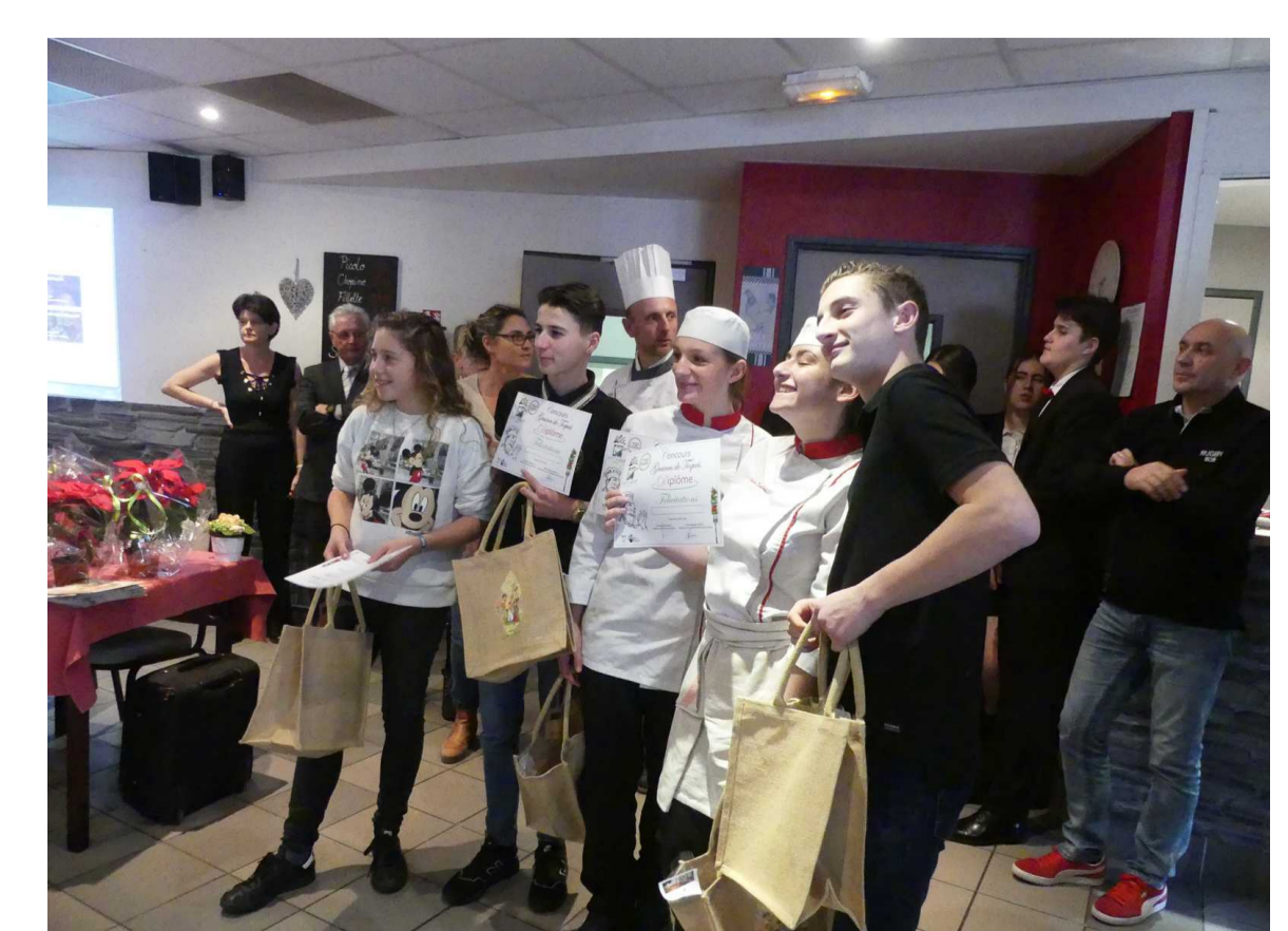
Remise des prix à l'équipe gagnante de ce premier concours « Graines de toqués » Janvier 2020

Le Campus Vert d'Azur d'Antibes s'associe au Lycée professionnel de Croisset à Grasse pour proposer un évènement culinaire, façon « Top Chef »