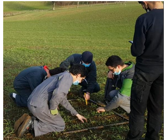
Figure 3 : Evaluation du nombre d'adventices présentes par les étudiants en BTSA GDEA.

efficace de limiter les adventices. Nous avons d'ailleurs observé un développement contenu de ces dernières dans la partie conduite en bio qui avait été labourée.