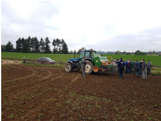
Figure 2 : Semis des couverts.

déchaumage avec un outil à dents et un semis au combiné herse-rotative semoir. Les couverts ont été implantés directement à suivre avec un semoir en ligne.